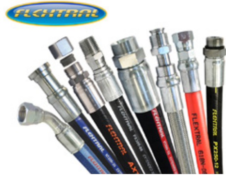
FLEXTAL(フレクストラル) 北米プレミアム油圧ホース

プレミアム油圧ホース事業は、新機直納用～市販用～ソリューションを連動したビジネスモデルを強みとしています。プレミアム戦略強化に向けて、ゴム材料などを操る「高分子複合体を極める」、タイヤ技術を活用した「高圧を極める」などタイヤで培ったコアコンピタンスを活用することで断トツ商品を強化すると共に、タイ工場の生産能力増強投資を通じて、生産・供給体制を拡充していきます。さらにソリューション強化に向けて、当社米国グループ会社ブリヂストン ホースパワー エルエルシーより、米国モバイルサービスプロバイダー「Cline Hose & Hydraulics, LLC. (以下Cline社)」を買収しました。全米に展開する47の自社サービス拠点にCline社のネットワークを加えることで、米国におけるモバイルバンソリューションネットワークを拡大し、ソリューション事業を強化していきます。