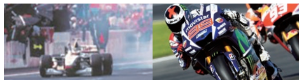
1997-2010 Formula 1® 1998 Round 16 Suzuka

当社は1963年の第1回日本グランプリからモータースポーツ活動を開始しました。挑戦の舞台を世界に広げ、1997年には、モータースポーツの最高峰であるF1®へ参戦しています。翌1998年には、ブリヂストンのタイヤを使用するチームが年間チャンピオンを獲得しました。その他、ファイアストーンブランドで1995年に米国INDYCAR® SERIESへ復帰、二輪の世界最高峰レースであるMoto GP™にも2005年に参戦しました。この「極限」への「挑戦」が、当社がグローバルカンパニーとして世界中でプレミアムタイヤを基盤としたビジネスを展開する原動力となりました。