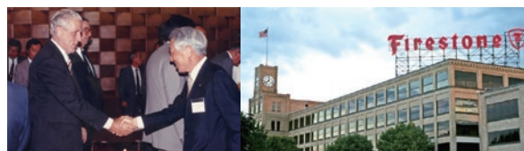
ファイアストーン社買収(1988年)