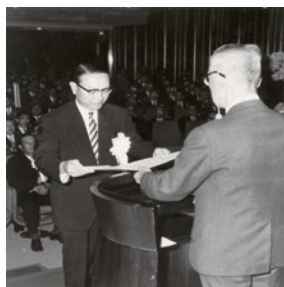
デミング賞実施賞を受賞(1968年)