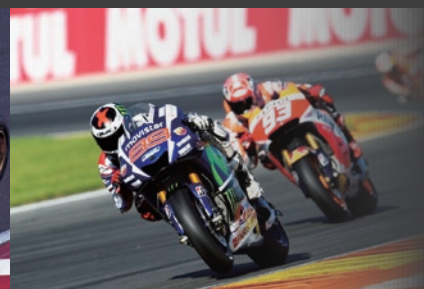
MotoGP™ 参戦 第18戦 (於バレンシア)

メーカーとしての総合力をさらに磨き、「極限」に挑戦することで、サステナブルにモータースポーツを足元から支えています。その一つの取り組みとして、乾燥地帯で栽培可能なグアユールから採取した天然ゴムを使ったレースタイヤの開発など、再生可能資源比率の高いタイヤ開発を推進しています。2022年にはグアユール由来のタイヤをNTT INDYCAR® SERIESに供給し、その性能を実証しています。当社のサステナビリティへの取り組みは、国際自動車連盟(FIA)の環境マネジメントプログラム「FIA 環境認証プログラム」においても認められ、最高位である3つ星を獲得しています。