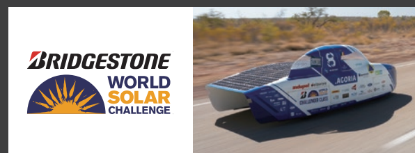
Bridgestone World Solar Challenge

従来からのレースへのサポートも含め、4輪、2輪、デジタル、トップカテゴリーレースからアマチュアドライバーによる参加型レースまで、国内外で広く地道にモータースポーツを支え続けます。