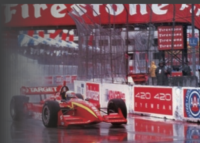
INDYCAR® SERIES 復帰