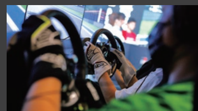
eモータースポーツへのサポート

》心動かすモビリティ体験を支えることから始まる「共創」 10年後、20年後にも走るワクワクを提供し続け、モータースポーツ文化の発展を支え続けるという決意とパッションを、「Bridgestone E8 Commitment」の中の「Emotion 心動かすモビリティ体験を支えることにコミットする」に込めています。そして、多くの仲間たちとモータースポーツを共に楽しみ、感動を共有することで、当社グループの挑戦に共感頂き、持続可能な社会の実現に向けて、未来を共に創っていく「共創」へと繋げていくことを目指していきます。従業員、社会、パートナー、お客様と一緒に、サステナブルにモータースポーツのエンジンを回し続け、盛り上げることで、この「極限」へのジャーニーを加速していきます。